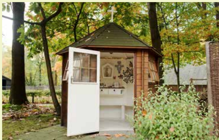
Een stiltekapel op Het Rijtven van Oro.