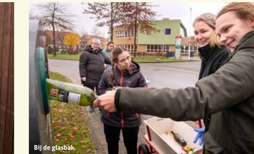
Bij de glashak.