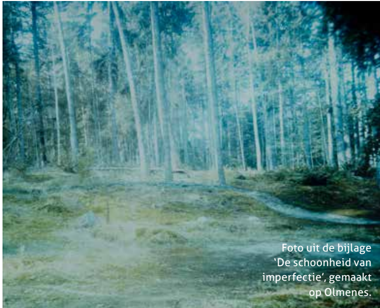
Foto uit de bijlage 'De schoonheid van imperfectie', gemaakt op Olmenes.